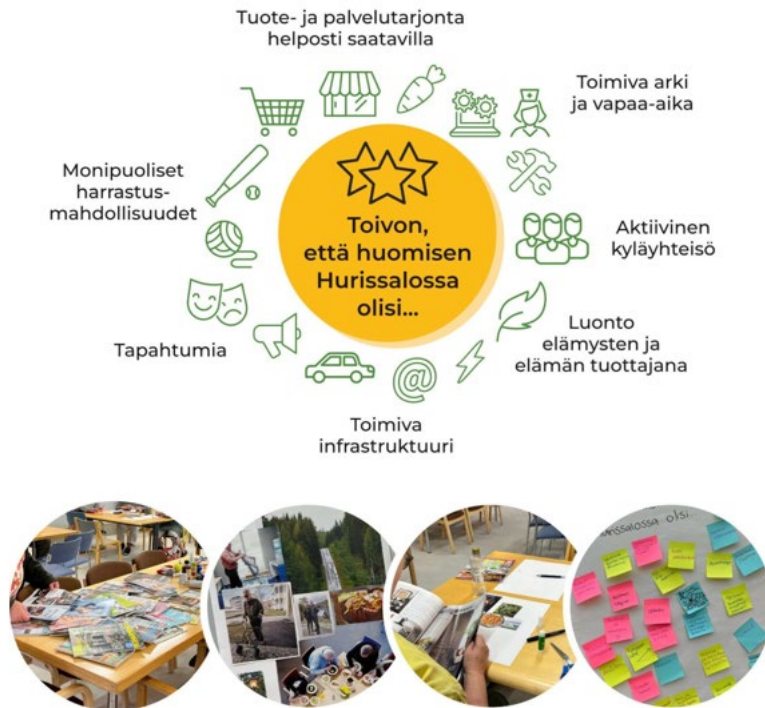
Kuva 2. Hurissalon kyläyhteisön jäseniä osallistavissa työpajoissa kerättiin tietoa sekä vakituisten että monipaikkaisten vapaa-ajan asukkaiden palvelutarpeista.

Työpajojen lisäksi toteutettiin verkkokysely, joka tavoitti laajemman joukon vakituksia kyläläisiä ja vapaa-ajan asukkaita Hurissalossa. Kyselyyn saatiin 71 vastausta. Kysely tavoitti erityisesti Hurissalon monipaikkaisia asukkaita; vastaajista vajaat 85 % asui Hurissalon ulkopuolella. Suurin osa vastaajista oli yli 55-vuotiaita, joista puolet oli siirtynyt eläkkeelle. Kyselyn avulla saatiin koostettua arvokasta tietoa Hurissalon kyläyhteisön palvelutarpeista ja kyläläisten mieltymyksistä. Kyselyn tuloksista kävi ilmi, millaisia palveluita ja toimintoja yhteisö arvostaa ja kaipaa.