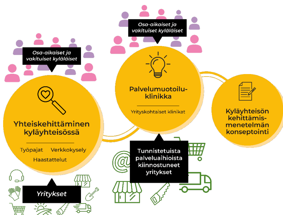
Kuva 1. Kohti palvelurikkaita kyläyhteisöjä -hanke kokosi kyläyhteisön palvelutarjonnan rikastamisen mahdollistavat kehittämismenetelmät monistettavaksi konseptiksi.

Kesällä 2022 käynnistyneessä ja vuoden 2023 lopussa päättyneessä, Etelä-Savon maakuntaliiton alueiden kestävän kasvun ja elinvoiman tukemisen määrärahasta rahoittamassa Kohti palvelurikkaita kyläyhteisöjä -hankkeessa keskityttiin Etelä-Savossa Puumalan kunnassa sijaitsevan Hurissalon kyläyhteisön palvelutarjonnan rikastamiseen. Hankkeessa tuettiin kyläyhteisön pohdintaa palvelutarpeista ja rohkaistiin uusien palveluideoiden muotoilua ja kehittämistä. Hankkeen aikana sovelletut työtavat – yhteiskehittämisestä palvelumuotoiluun – dokumentoitiin ja jalostettiin monistettavaksi konseptiksi, jota noudattaen voidaan tukea kyläyhteisöjen palvelukehitystä myös muualla monipaikkaisissa kyläyhteisöissä (Kuva 1).